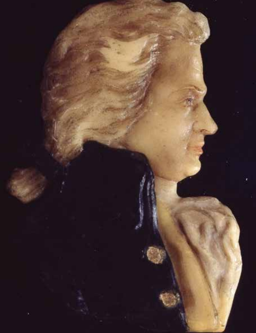
Wachsrelief von Wolfgang Amadeus Mozart und Joseph Haydn (anonym)