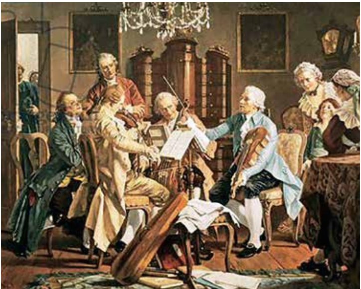
Joseph Haydn dirigeant un quatuor à cordes

c'est d'ailleurs le seul mouvement lent à se couler dans cette structure). Là aussi, il se distingue de ce qui se fait à son époque : loin des variations superficielles et purement décoratives de nombre de ses contemporains, il transforme le thème avec une imagination sans cesse renouvelée, met en valeur chaque instrument, intensifie l'expression au moyen du contrepoint et de l'harmonie. Ces qualités sont à l'œuvre également dans la finale dont le monothématisme pourrait avoir été pensé comme un hommage à Haydn : les mouvements à un seul thème sont fréquents chez l'aîné, tandis que Mozart penche spontanément vers la prodigalité des motifs. Par la suite, Ludwig van Beethoven, admirateur de cet Allegro non troppo , le recopiera entièrement pour mieux en assimiler les subtilités.