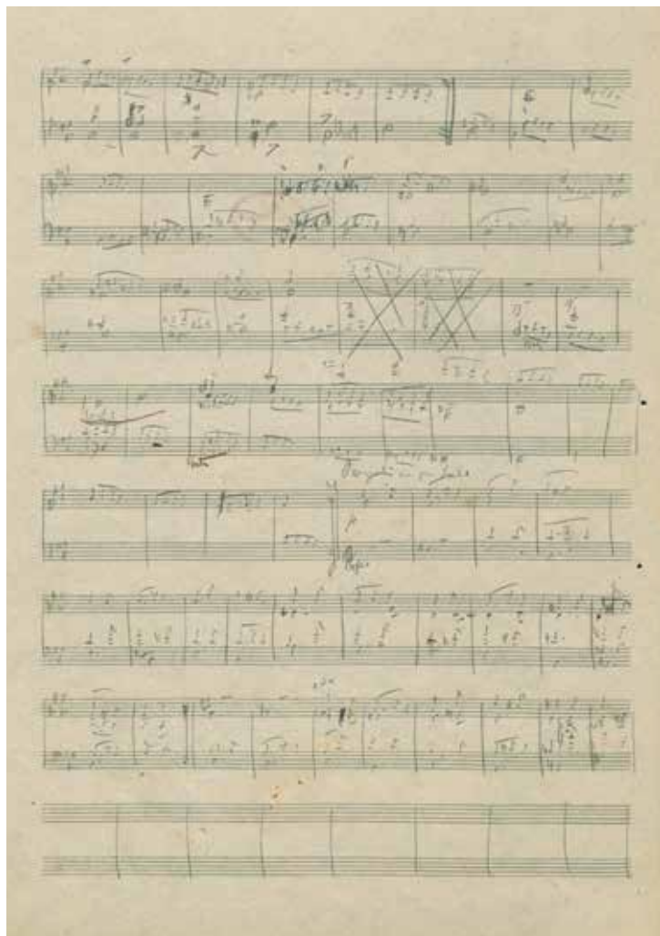
Robert Schumanns Skizzen zum Streichquartett op. 41/3 (1842)