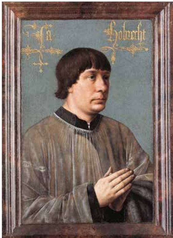
Portrait de Jacob Obrecht en 1496

Impossible de confondre l' Hommage à Jacob Obrecht avec de la musique du 15 e siècle. En revanche, certaines de ses sections sont fondées sur des procédés contrapuntiques, entremêlant les lignes dans l'esprit (mais pas la lettre) de la Renaissance. Cette écriture polyphonique alterne avec des sections vif-argent jouées sur le chevalet, fuyantes et fantomatiques, sorte de relecture d'une Fantasiestück schumannienne. Émergent également quelques