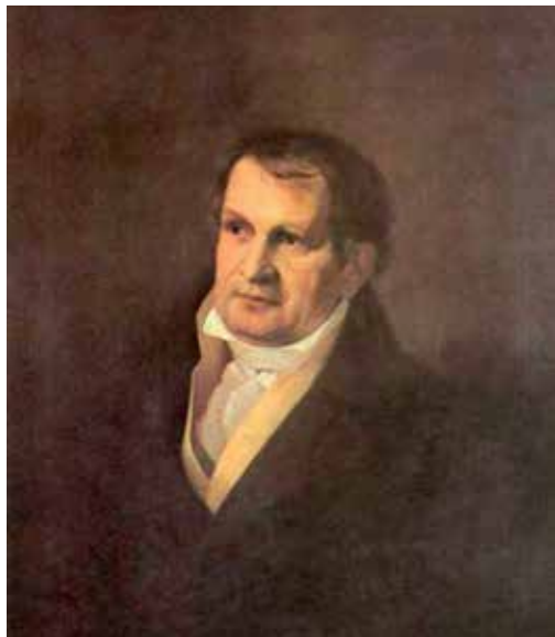
Ludwig Tieck, Gemälde von Robert Schneider um 1833