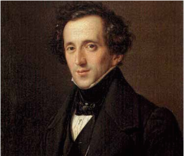
Portrait de Felix Mendelssohn Bartholdy par Theodor Hildebrandt, Leipzig, 1834

La mort prématurée en 1847 du génial compositeur est un coup rude. Après la Révolution de 1848 s'ouvre une période plus incertaine ; Julius Rietz (1849-1860), puis Gade (1847-1849), entretiennent néanmoins la flamme. Le long mandat de Carl Reinecke (1860-1895) voit l'augmentation du nombre de musiciens (de cinquante-six en 1853, ils passent à quatre-vingt-six en 1893). Malgré l'invitation de grands solistes, son ère est empreinte de conservatisme. Plusieurs opéras de Richard Wagner sont donnés de 1853 à 1870 au Neues Theater, ouvert en 1868. Reinecke inaugure le 11 décembre 1884 le nouveau Gewandhaus. Conçu par Martin Gropius et Heinrich Schmieden, comportant deux salles de 1450 et 640 places, le bâtiment s'impose