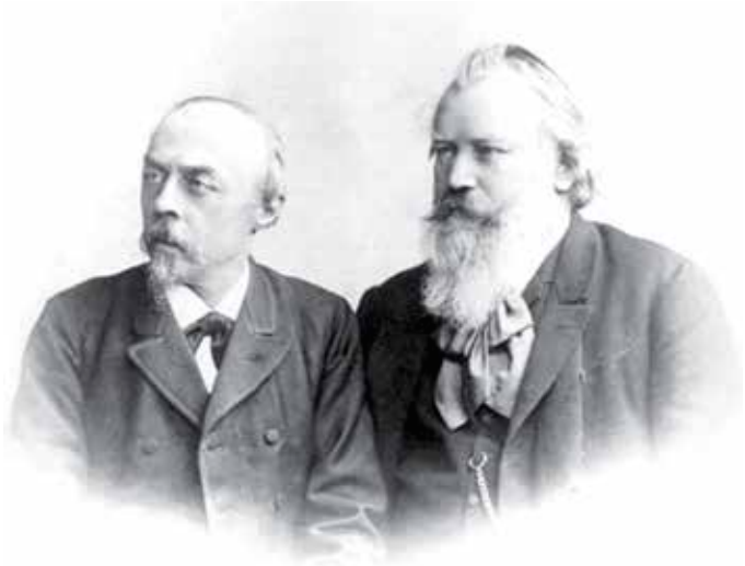
Hans von Bülow und Johannes Brahms