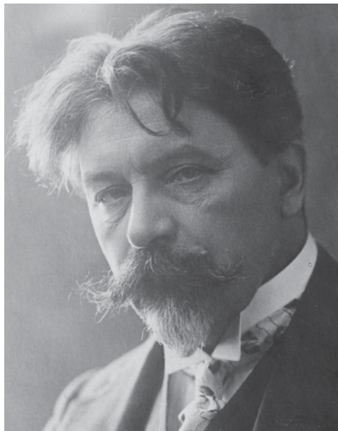
Arthur Nikisch en 1920

Mozartien émérite, mahlérien militant, attentif aux nouveaux talents (Dmitri Chostakovitch), Walter subit les conséquences de la crise économique de 1929. Karl Straube, successeur de Johann Sebastian Bach comme Cantor de Saint Thomas (1918-1939), Gustav Brecher, Generalmusikdirektor au Stadttheater depuis 1924, Hermann Scherchen aussi, marquent l'entre-deux guerres. En tournée en 1930 avec le New York Philharmonic, Arturo Toscanini est impressionné par « l'atmosphère classique » du Gewandhaus. Elle va voler en éclats avec l'avènement du nazisme, synonyme d'exil brutal pour Brecher et Walter. Les interdictions induites par le dogme criminel de la « musique dégénérée » se doublent de la destruction en 1936 du monument à Mendelssohn de Werner Stein, érigé en 1892 devant le Gewandhaus. Admiré de longue date par les musiciens, Hermann Abendroth sera le Gewandhauskapellmeister des années noires,