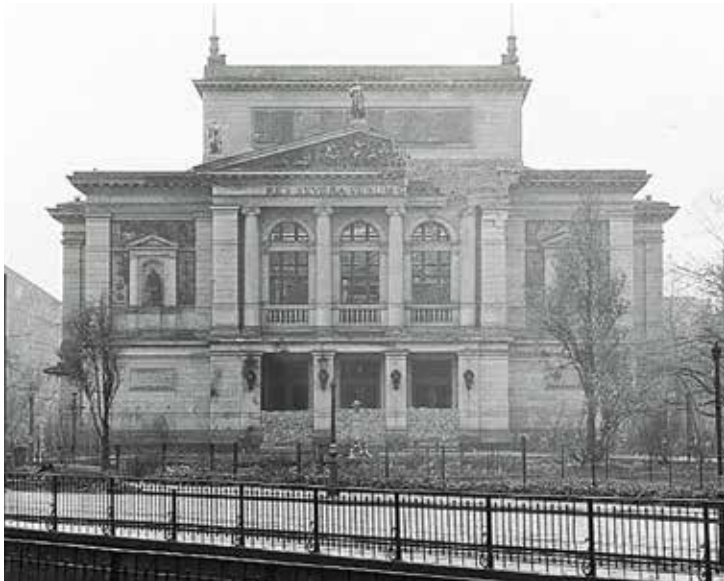
Le Gewandhaus en 1947

Commence une difficile période de reconstruction, dont Herbert Albert, Gewandhauskapellmeister de 1946 à 1948, essuiera les plâtres avec détermination. Le nouveau monument à Mendelssohn, érigé en 1947