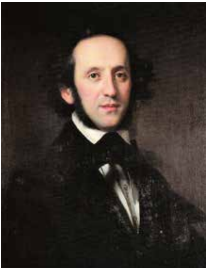
Felix Mendelssohn Bartholdy