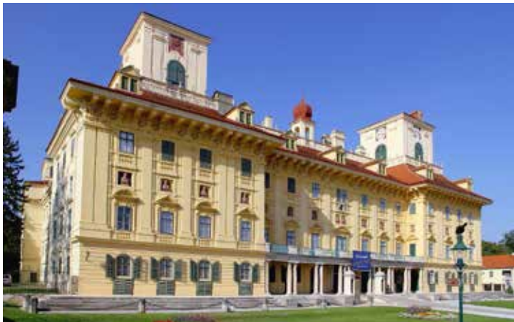
Le Palais de la famille Esterházy

contrairement à ce que laisse penser leur nom – à la famille des hautbois, sont fréquemment utilisés par Haydn dans sa musique vocale tout au long de la décennie 1760 ainsi qu'au début de la décennie 1770, cette œuvre semble être la seule symphonie (de son auteur, mais même dans toute l'histoire du genre) à utiliser cette instrumentation. Pour autant, elle manifeste comme les autres symphonies de Haydn dès cette époque l'intérêt du compositeur pour une orchestration qui exploite en tant que telle la sonorité des instruments à vent plutôt que de les cantonner à une utilisation en doublure des cordes ou en harmonisation. Le début du premier mouvement, en dialogue entre les cors et les cors anglais, ou le finale avec ses sonorités de chasse le montrent bien.