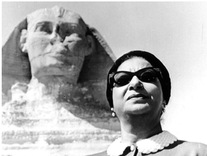
Oum Kalthoum, aus dem Film Umm Kulthum, A Voice Like Egypt

Sängerin hatte es geschafft, sich nicht nur über Zwänge einer traditionell patriarchalischen Gesellschaft hinwegzusetzen. Ab den 1940er Jahren gelang es ihr neben einer zweiten Karriere als Filmschauspielerin, auch die künstlerische Kontrolle über ihre Musik zu behalten. Darüber hinaus entwickelte sie eine eigene und emotional bewegende Variationstechnik des Gesangs, die ihre abendfüllenden Programme zu Pilgerterminen für Fans weit über Ägypten hinaus werden ließen.