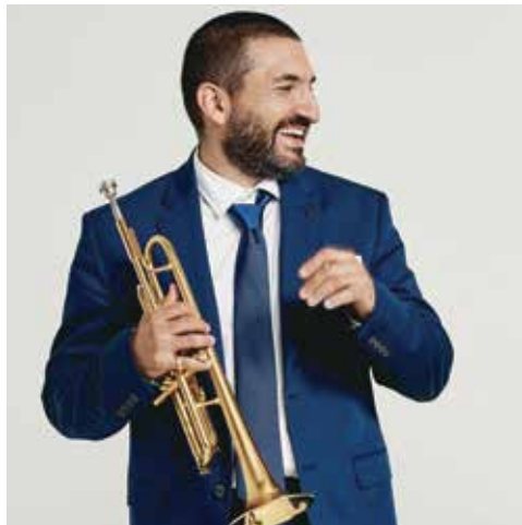
Ibrahim Maalouf

Denn wer sich und anderen aufmerksam zuhört, wird so schnell an kein Ende kommen: «Improvisation nährt sich aus allen existierenden Quellen, unseren Sinnen, unseren Erfahrungen. Nichts erfindet sich von Grund auf neu, alles ist eine Frage der Erneuerung. Die Welt ist eine ständige Wiedererschaffung. Egal, ob ich bei der Familie bin, bei Freunden, im Unterricht, im Kino, Studio, im Konzert, selbst im Schlaf – ich improvisiere. Manchmal verwende ich dafür die Trompete, manchmal das Klavier und oft einfach nur meinen Kopf. Ich grabe nie besonders nachdrücklich in meiner Erinnerung oder meinen Kenntnissen, ich versuche nicht, mich ausdrücklich auf Musik zu beziehen, die ich schon gehört habe. Aber ich lasse mich emotional von allem beeinflussen, was mich umgibt, ohne zu hierarchisieren oder zu urteilen: von einer Form, einer Farbe, einem Lärm, einem Geruch, einem Puls, von zwei Noten, die zufällig zusammenklingen, von einer Stimme, aber auch von klassischer Musik, Jazz, Pop, Folklore, Moderne, Zeitgenössischem, Traditionellem etc. Die ganzen Ideen kommen zu mir und ich versuche, sie möglichst frei und