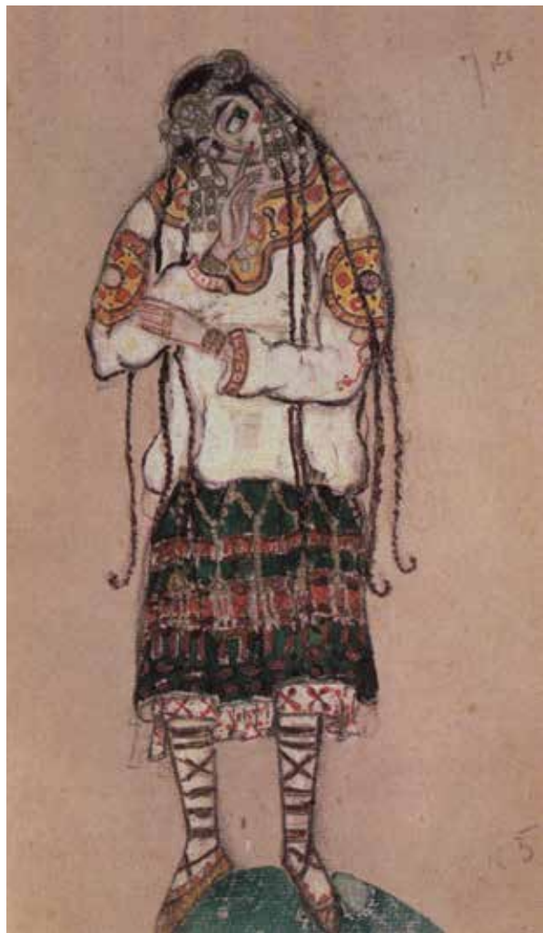
Projet de costume d'une jeune fille par Nicolas Roerich