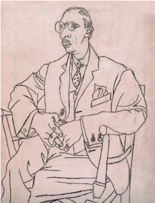
Igor Strawinsky. Porträt von Pablo Picasso 1920

eigentlichen ästhetischen Gegenstands haben. Der verpasste Bus, der die rituelle Brezel vorm Konzert im Foyer verhindert, kann den Eindruck einer Interpretation durchaus trüben; während der besonders charmante Kellner im traditionell nach dem Konzert aufgesuchten Restaurant die Uraufführung des ersten Konzerts nachträglich in viel strahlenderem Licht erscheinen lassen kann.