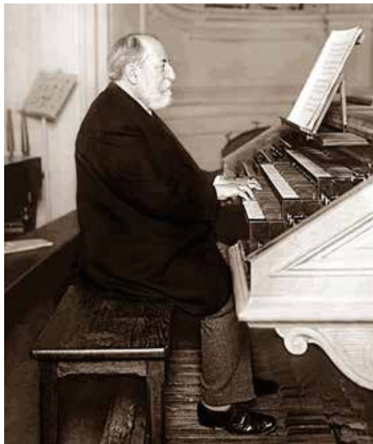
Camille Saint-Saëns à l'orgue de la Salle Gaveau à Paris

lui résista longtemps. Ce prodigieux virtuose offrit un vaste corpus à l'instrument qui le porta à travers les continents, le piano. Son legs à l'orgue est moins fourni, surtout qu'il s'agit pour certaines pièces conçues à l'origine pour le tout récent harmonium, star des salons. On comprend donc que Kit Armstrong, qui passe tout aussi brillamment que Saint-Saëns d'un instrument à l'autre, ait puisé principalement dans son œuvre pianistique.