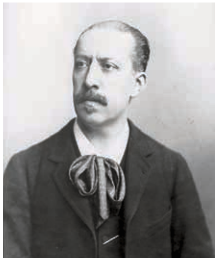
Charles-Marie Widor (1905)