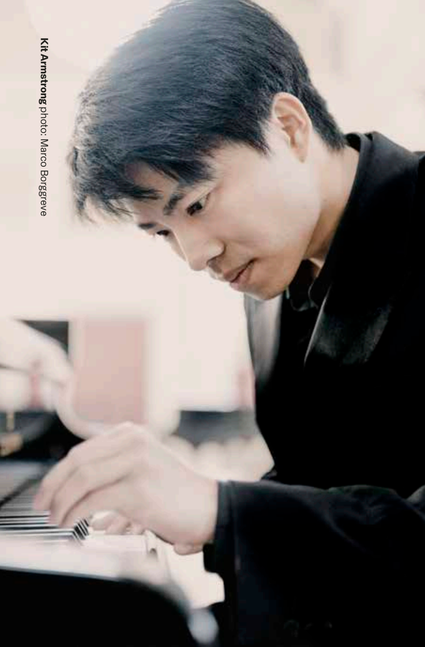
Kit Armstrong