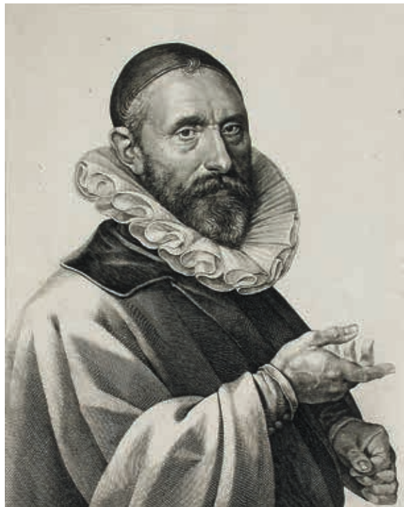
Portrait de Jan Pieterszoon Sweelinck par Jan Harmensz Muller Los Angeles County Museum of Art

Kit Armstrong clôt son programme par une symphonie imaginaire en fa majeur, dont trois des quatre mouvements émanent de ce genre, consubstantiel aux orgues de Cavaillé-Coll, dont Widor fut l'inventeur : la symphonie pour orgue. Widor dédia d'ailleurs ses quatre premières symphonies, réunies au sein de l'opus 13, à l'éminent facteur, dont il fut l'un des plus ardents zéloteurs. Cet ensemble publié en 1872 est l'œuvre d'un musicien de vingt-huit ans, encore imprégné des