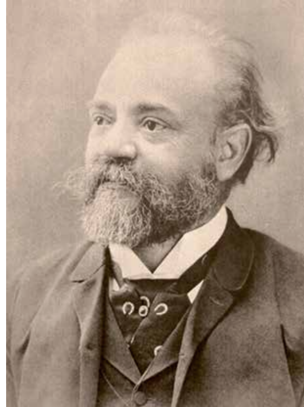
Antonín Dvořák 1893

und einem Klavierstück, der berühmten Valse sentimentale op. 51/6. Das Duett zwischen Liza und Polina aus dem ersten Akt der Pique Dame (« Ouj, ouj vietcher... oblakov pomierknouli kraya ») bildet in