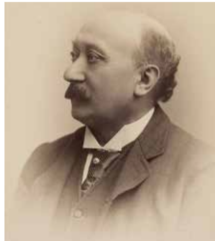
Luigi Arditi, vers 1903

On reste dans l'opéra italien, retrouvant, après Cilea, la tendance vériste de la fin du 19 e siècle, qui accentue les effets violents des passions exacerbées par la jalousie. Dans Paillasse (1892) de Ruggero Leoncavallo (1857–1919) dont l'action se déroule à l'intérieur d'une troupe théâtrale ambulante, la belle comédienne Nedda, épouse du directeur Canio, souffre de la jalousie de son époux. Elle contemple les oiseaux, écoute leurs chants et envie leur liberté. L'accompagnement imite les stridulations des volatiles et imprime au monologue une légèreté lumineuse tandis que la voix s'épanche dans l'exaltation des mouvements du vol et donne la mesure de leur ampleur dans l'espace aérien.