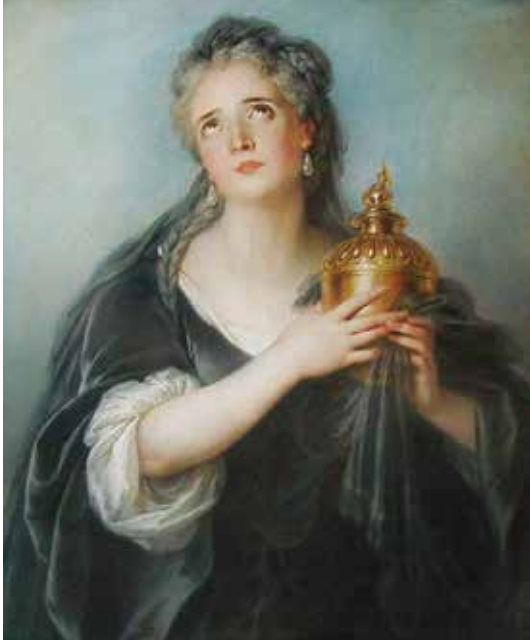
Charles-Antoine Coypel, Adrienne Lecouvreur dans le rôle de Cornélie dans La Mort de Pompée , 1721–1724 Comédie-Française

bouillonnement joyeux du printemps. Et c'est en toute logique que lui succède le moment le plus fort de l'opéra Snégourotchka ( La Fille de neige , 1881), « conte printanier » adapté d'une pièce d'Alexandre Ostrovski (1823–1886). Fille de la Fée du Printemps et du Bonhomme Hiver, Snégourotchka, créature élémentaire surgie entre deux mondes, vient vivre chez les humains, suscite diverses passions et tombe amoureuse du riche marchand Mizghir. Mais au moment où elle lui jure son amour devant le tsar, les rayons ardents de Yarilo, dieu-soleil des anciens Slaves, l'embrasent et elle fond, retournant à l'élément originel. La ferveur du serment est interrompue par les accords