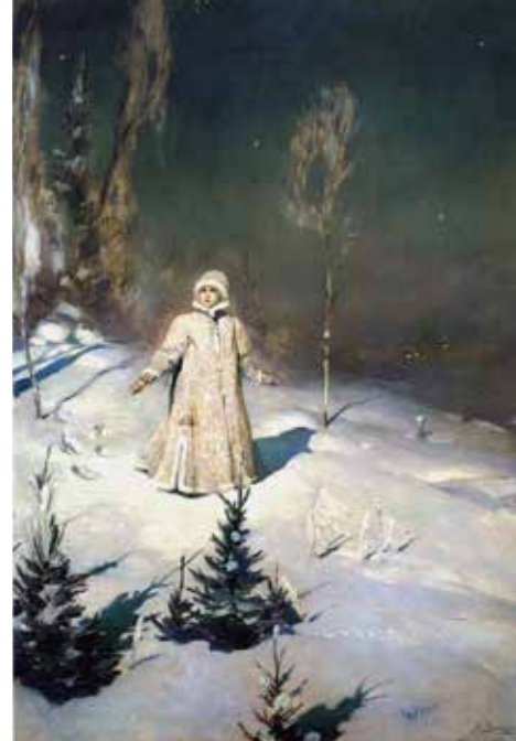
Viktor Vasnetsov, Snégourotchka , 1899 Moscou, Galerie Tretiakov

bouillonnement joyeux du printemps. Et c'est en toute logique que lui succède le moment le plus fort de l'opéra Snégourotchka ( La Fille de neige , 1881), « conte printanier » adapté d'une pièce d'Alexandre Ostrovski (1823–1886). Fille de la Fée du Printemps et du Bonhomme Hiver, Snégourotchka, créature élémentaire surgie entre deux mondes, vient vivre chez les humains, suscite diverses passions et tombe amoureuse du riche marchand Mizghir. Mais au moment où elle lui jure son amour devant le tsar, les rayons ardents de Yarilo, dieu-soleil des anciens Slaves, l'embrasent et elle fond, retournant à l'élément originel. La ferveur du serment est interrompue par les accords